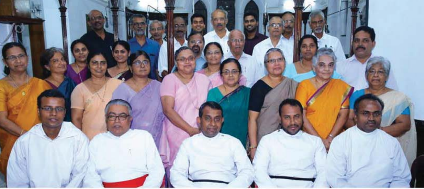
Convention Choir - 2015