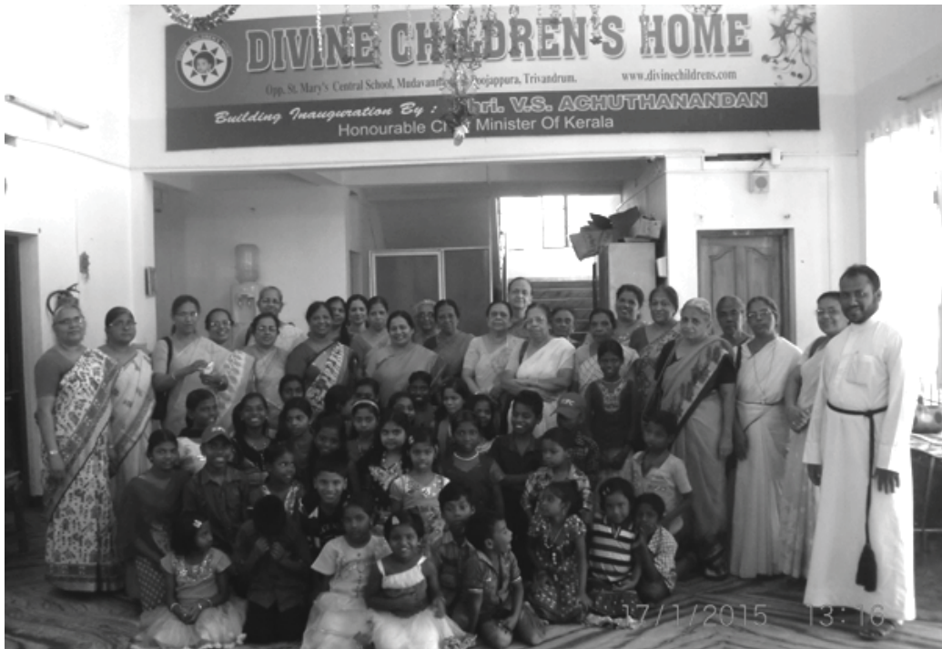
സ്ട്രീജനസഖ്യത്തിന്റെ ചിൽഡ്രൻസ് ഡിവൈൻ ഹോം സന്ദർശനം