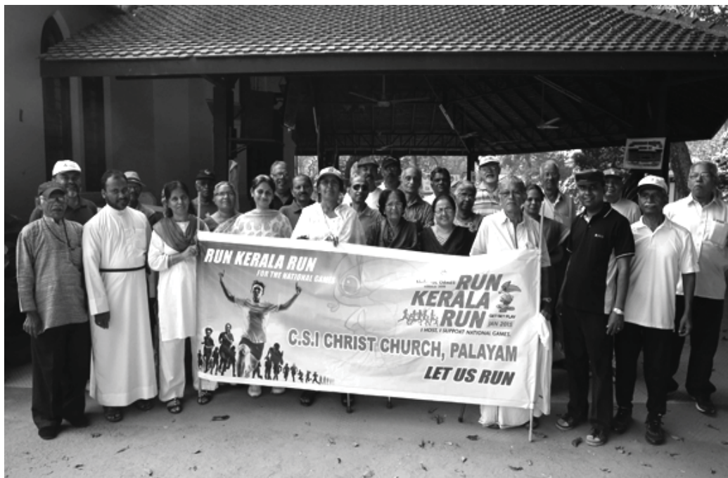
RUN KERALA RUN