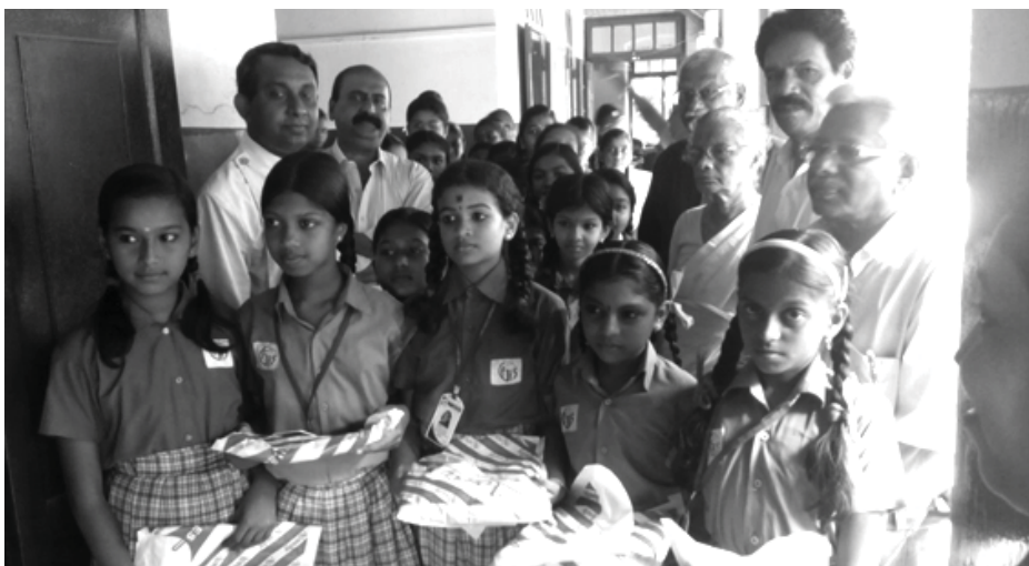
ആൽത്തായ ഫെലോഷിപ്പ് - ഫോർട്ട് മിഷൻ സ്കൂളിലെ കുട്ടികൾക്കുള്ള യൂണിഫോം വിതരണം