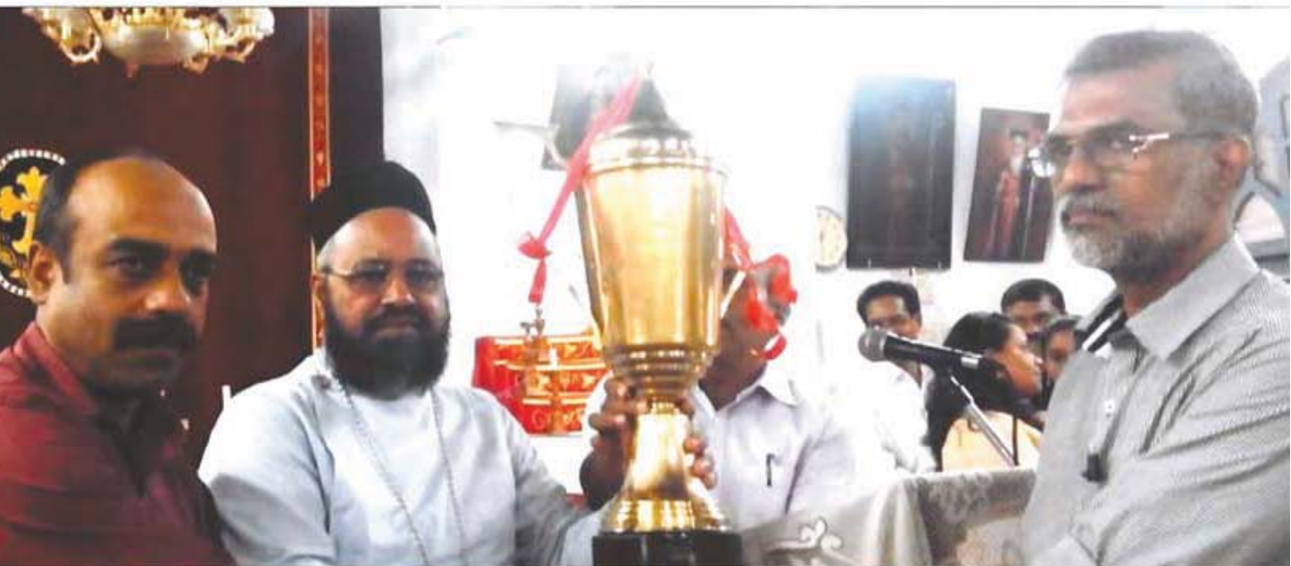
UCM Trophy for the Best Illuminated Church during Christmas