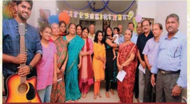
Kowdiar - Kuravankonam