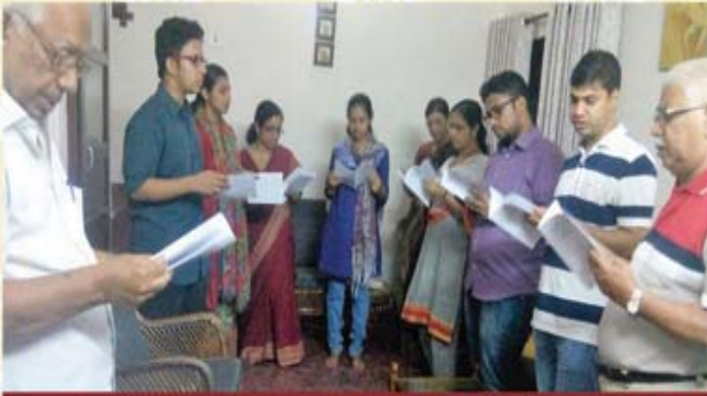
Pettah - Manacaud