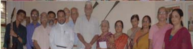
Pattom - Plammood