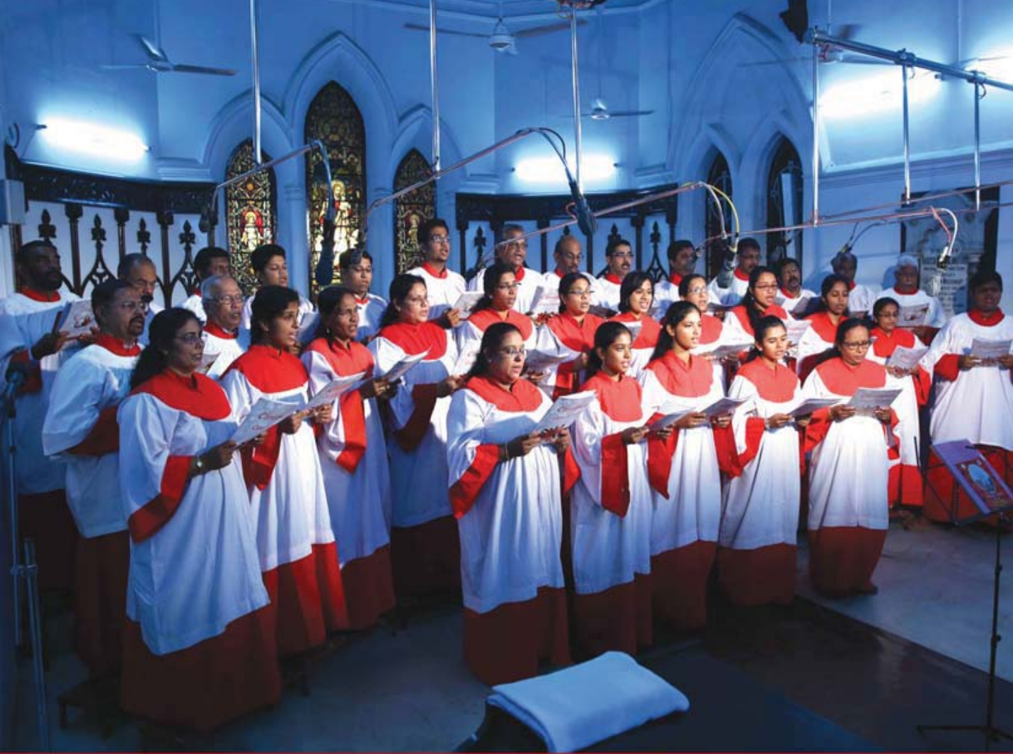
CHRISTMAS CAROL SERVICE 24 th December 2015