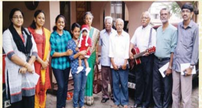
PTP Nagar - Vattiyoorkkavu