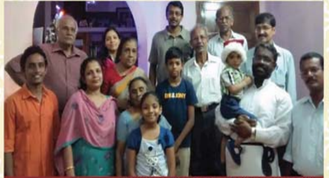
Medical College - Kannammoola