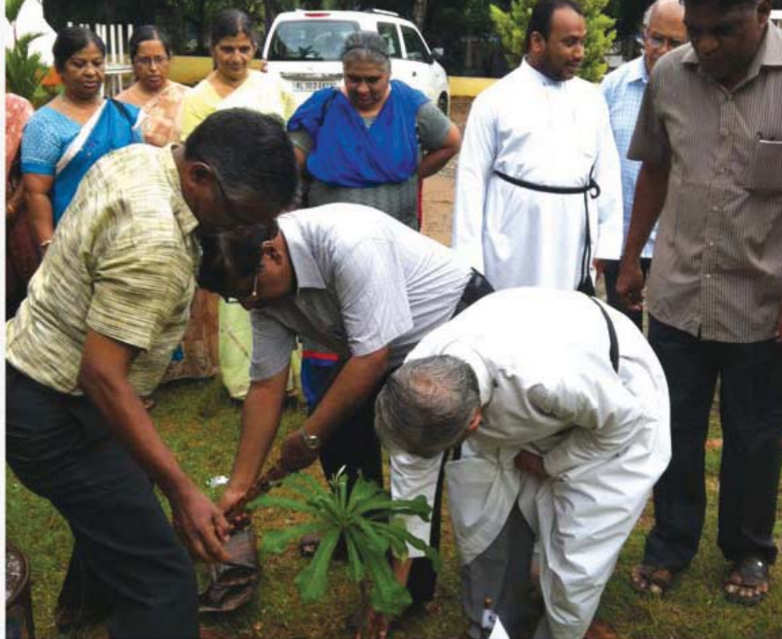
Planting of Saplings in the Church Compound on World Environment Day on 5 th June 2015 Organized by the Christ Church Ecology Forum