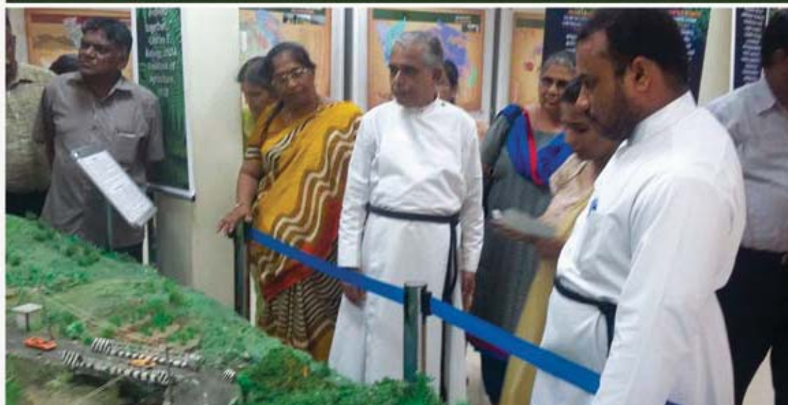
WORLD ENVIRONMENT DAY Visit to State Soil Museum, Govt. of Kerala, Parottukonam, on 5 th June 2015 - Organized by the Christ Church Ecology Forum