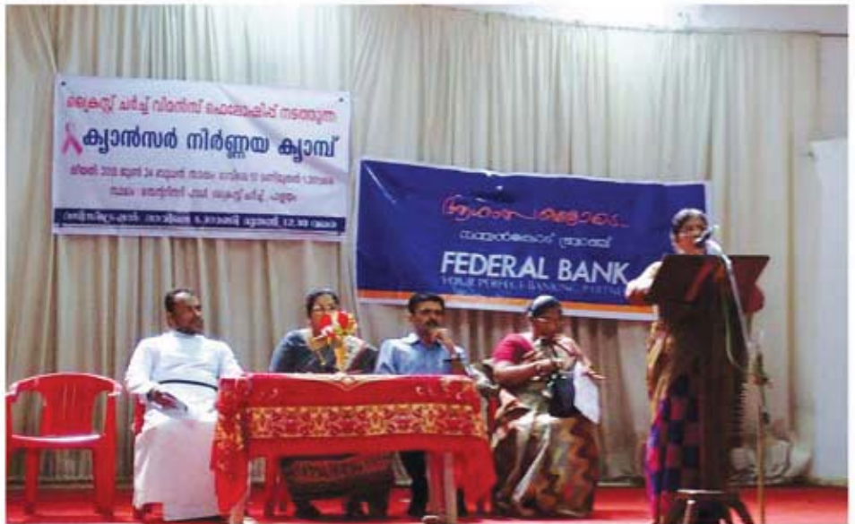
Women's Fellowship Cancer Detection Camp On 24th June 2015 at Centenary Hall