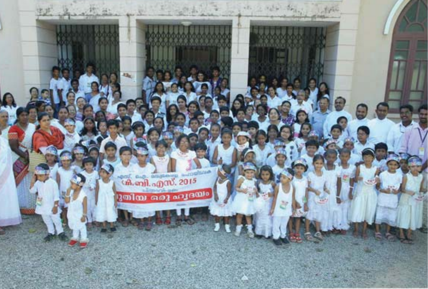
Vacation Bible School 2015