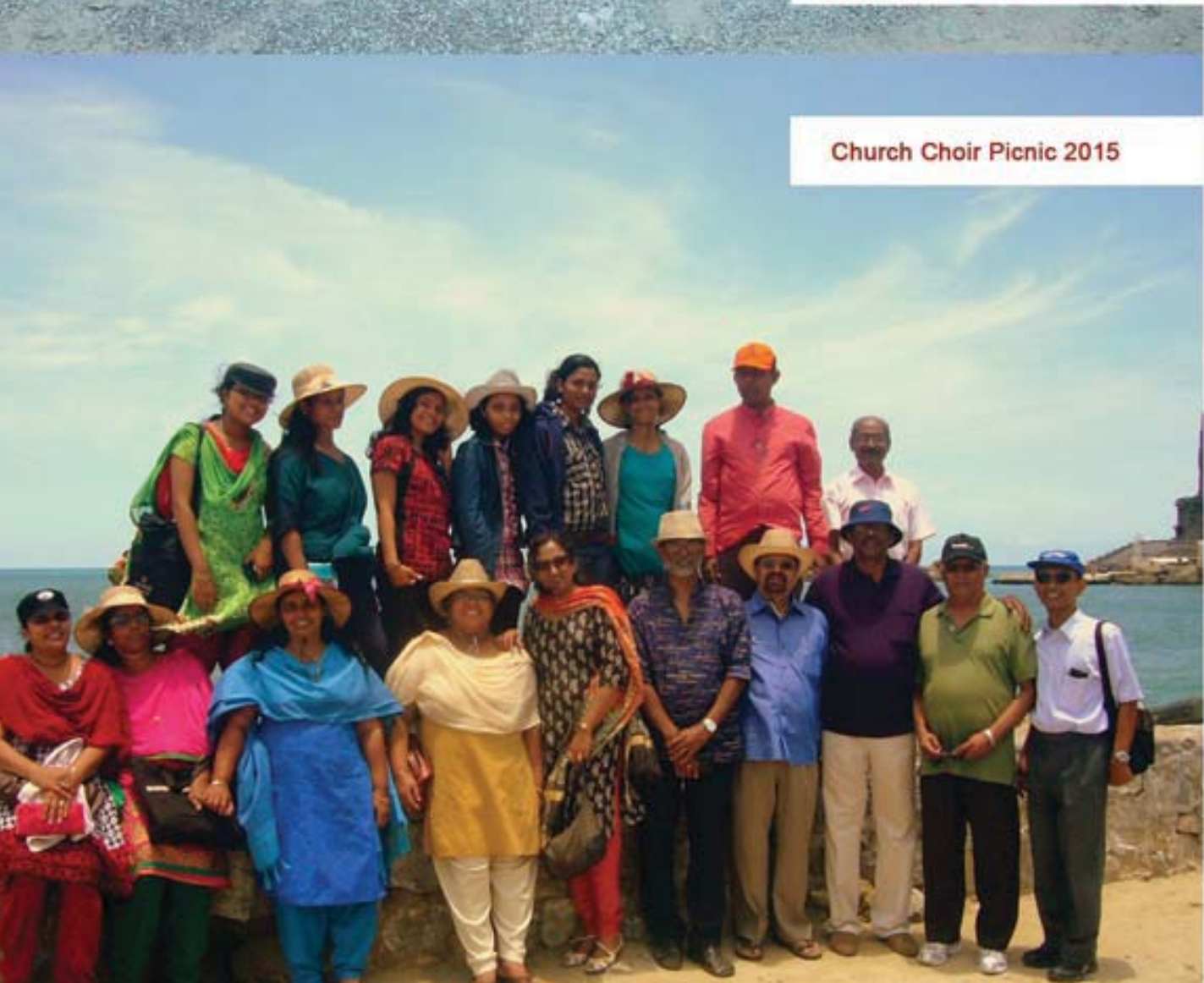
Church Choir Picnic 2015