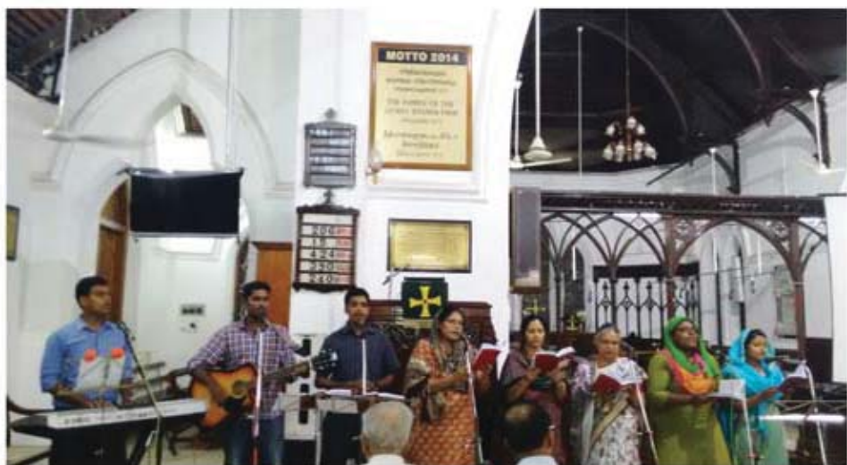
Praise & Worship Service - October 19, 2014