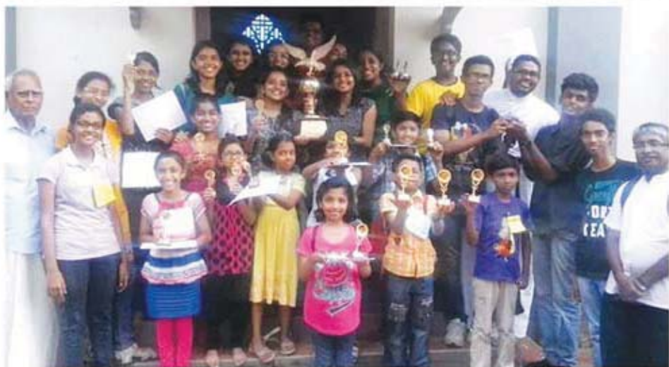
OVERALL CHAMPIONS Adoor District Sunday School Competitions 2014