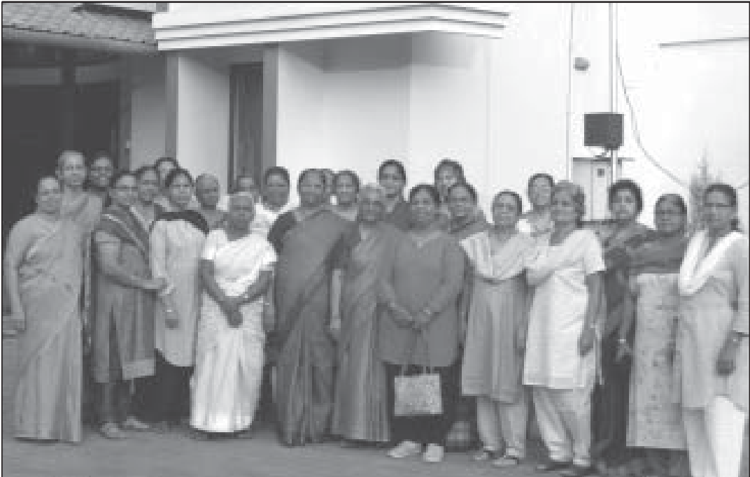
Women's Fellowship Members in front of the Marthoma Guidance Centre, Vytilla during their picnic to Athirappally on 20 & 21 January 2016