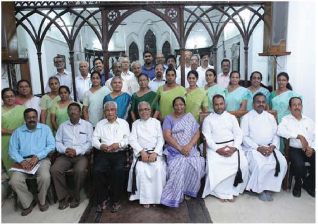
Christ Church Convention Choir Christ Church Convention - January 8, 9 & 10, 2016