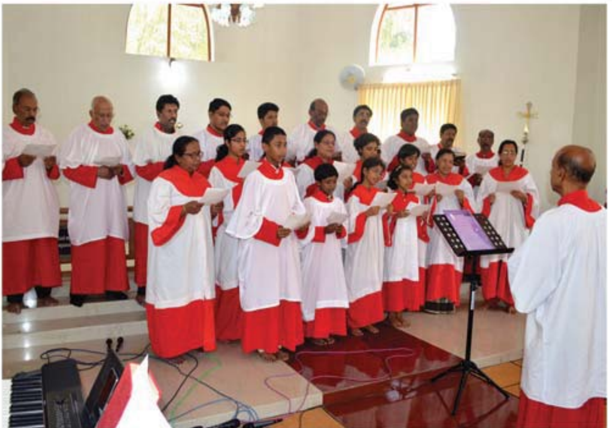
Our Choir participated in the Adoor District Choir Festival at Nellimugal on 13 th February 2016