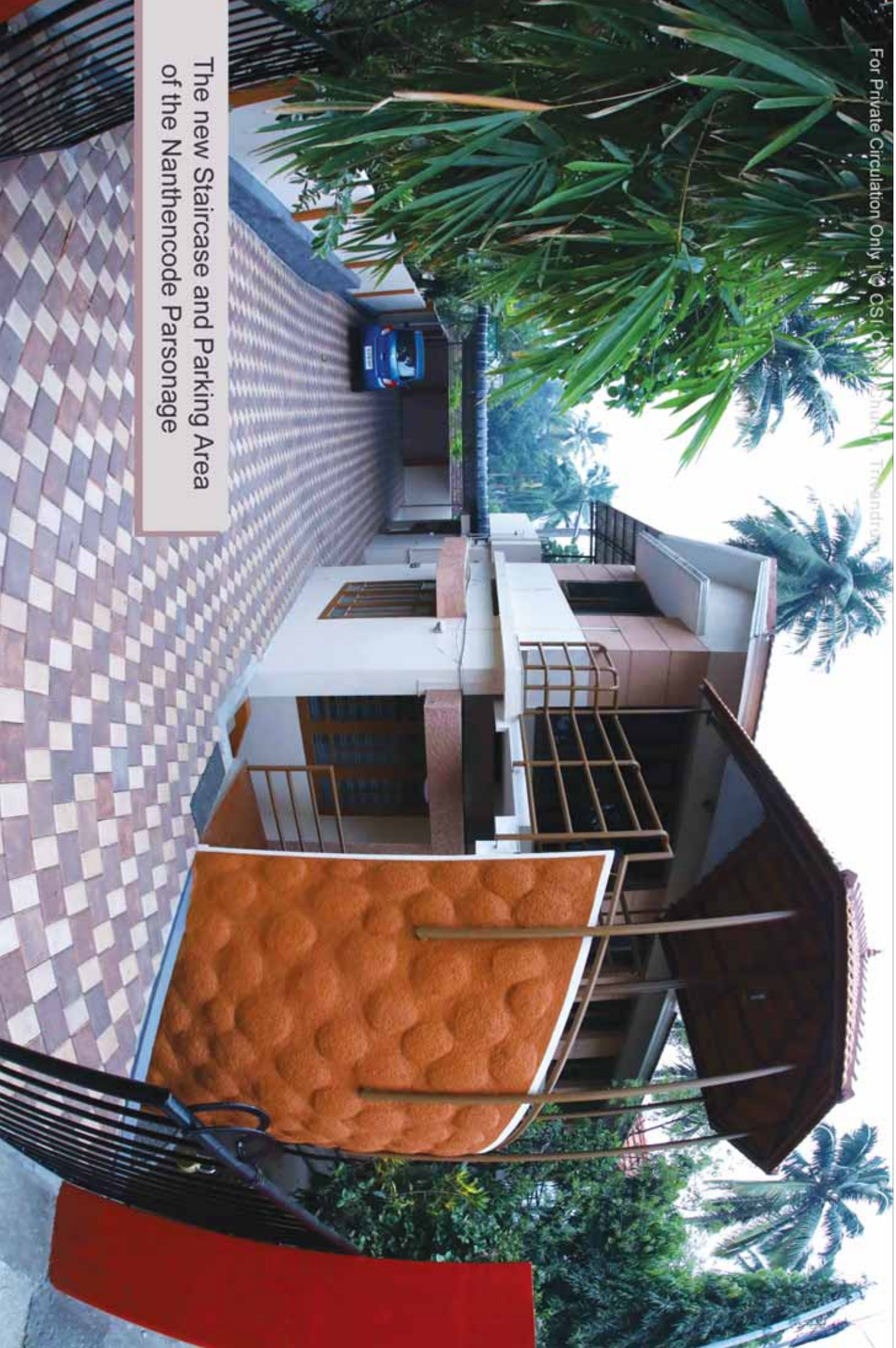
The new Staircase and Parking Area of the Nanthencode Parsonage