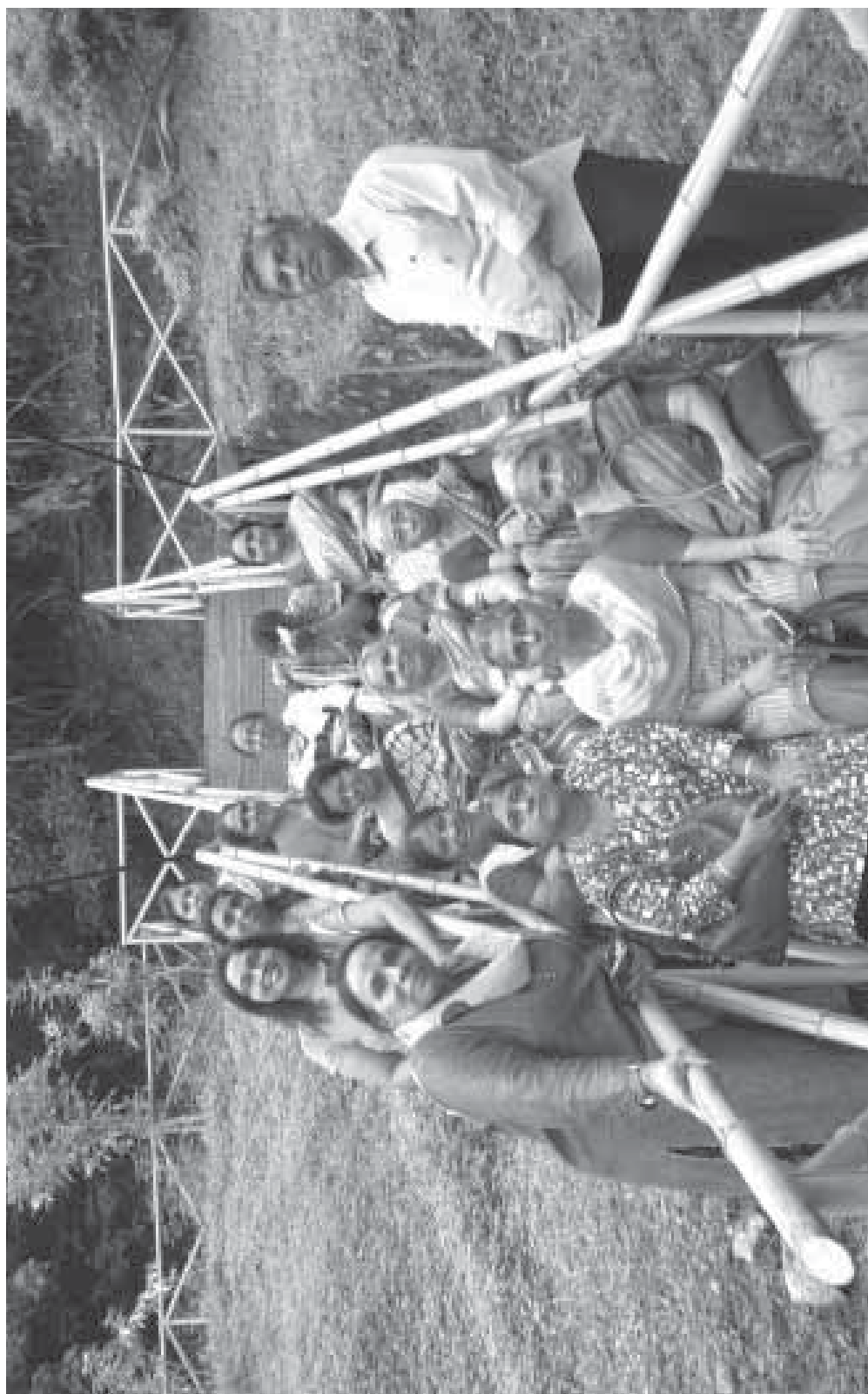
Women's Fellowship Visit to Thenmala on 29th October 2016