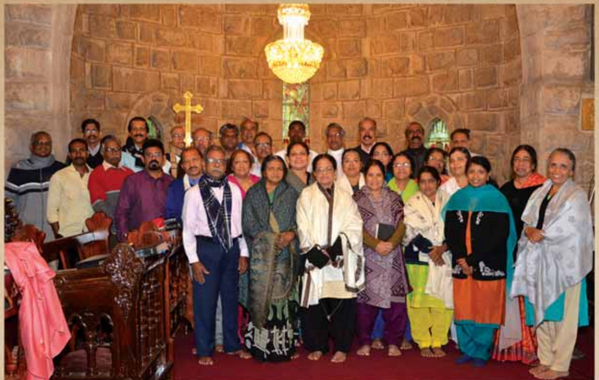
Ecology Study Tour Team at CSI Christ Church, Munnar