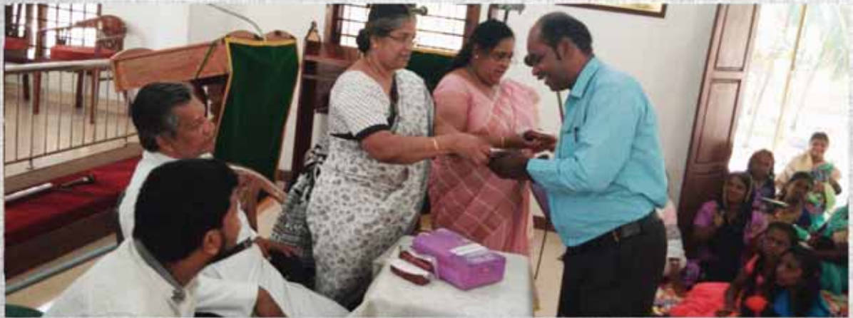
Distribution of spectacles as part of the eye camp by Womens Fellowship