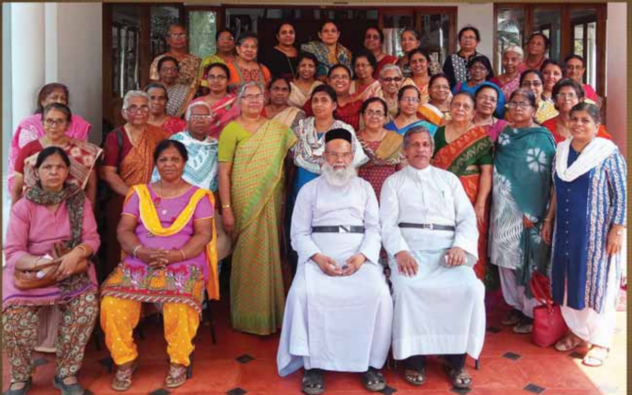
Womens Fellowship Picnic to Sasthamkotta