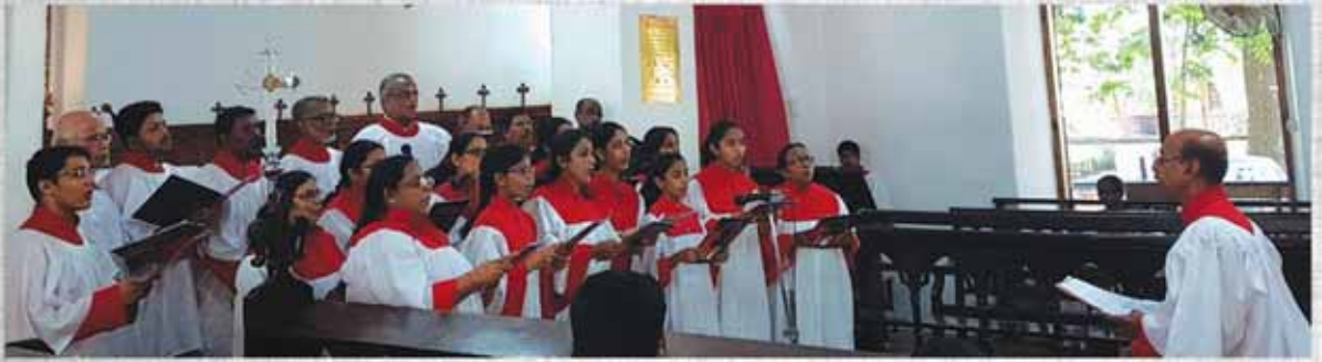
Choir Festival at Kollam