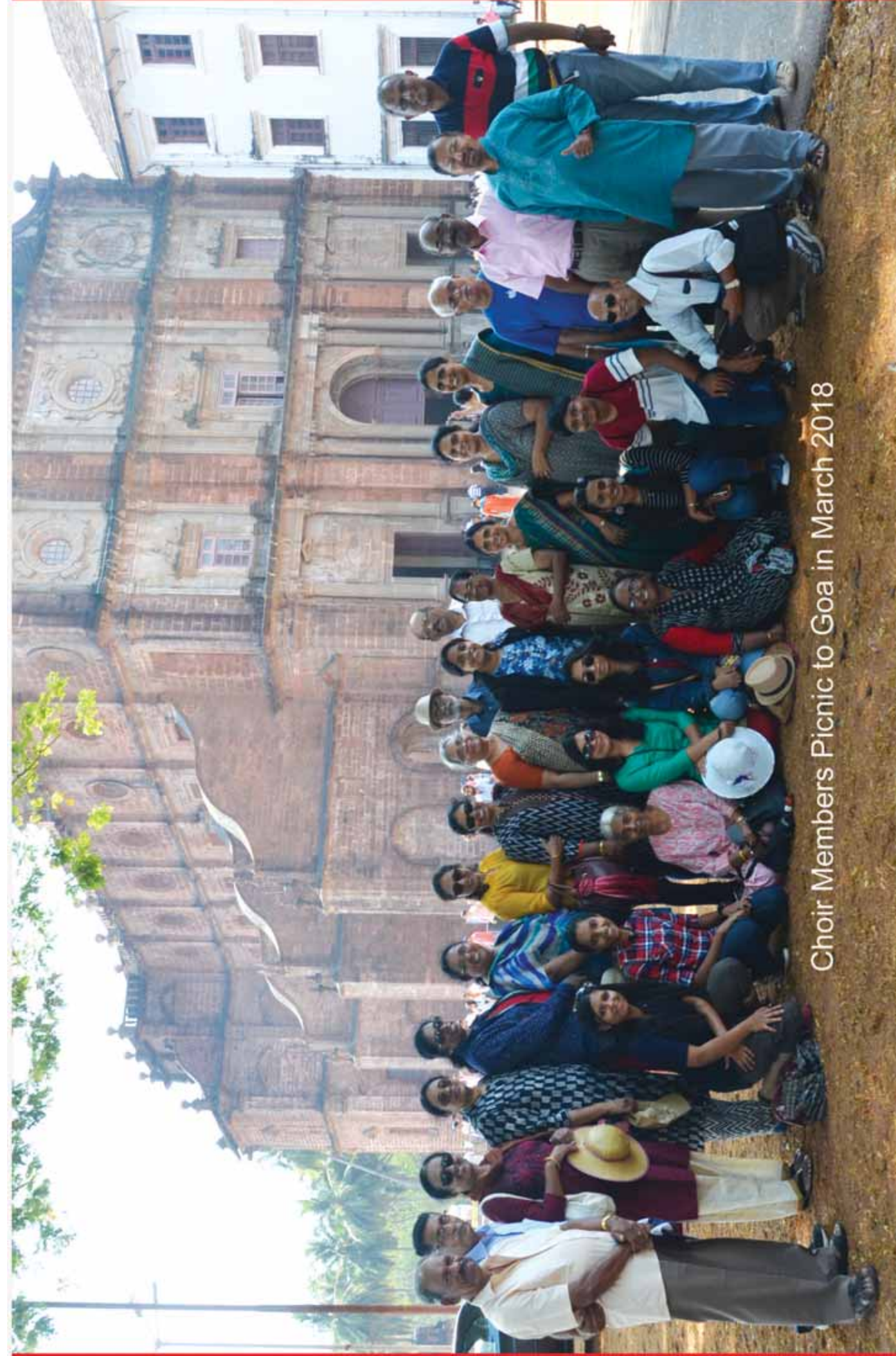
Choir Members Picnic to Goa in March 2018