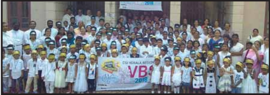
Vacation Bible School Closing Ceremony 13th April 2018