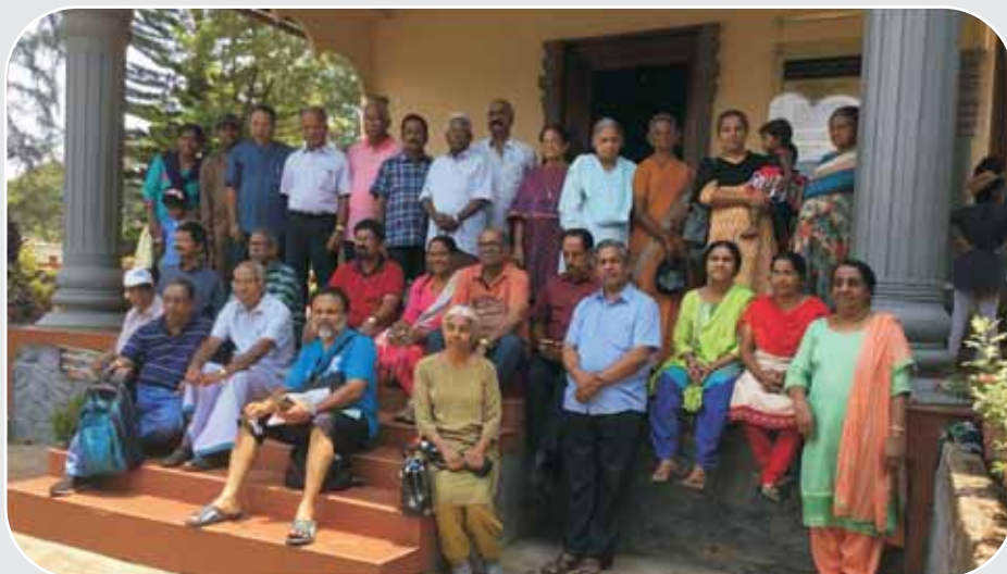
Almaya Fellowship Trip to Wayanad - 24 th to 27 th April 2018