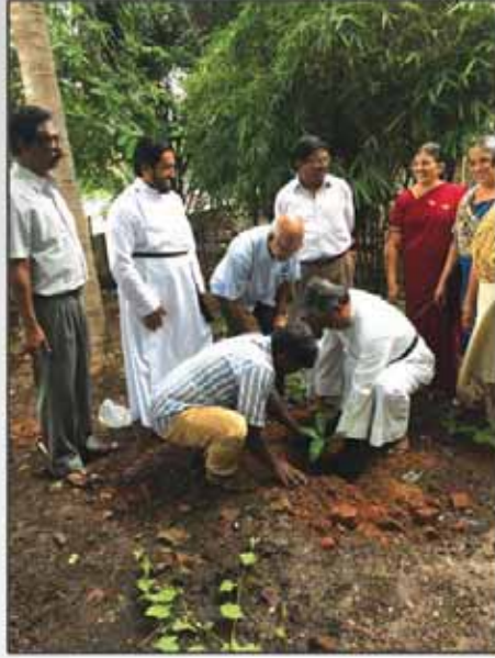
Environment day Programme at Church on 5th June