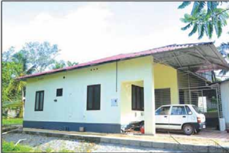
Muttathara Mission House