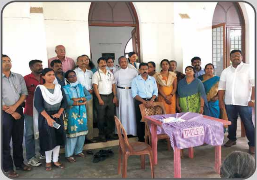
Our Team Members