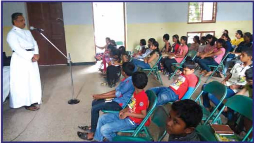
Sunday School Camp at Fern Hill on 19, 20 October