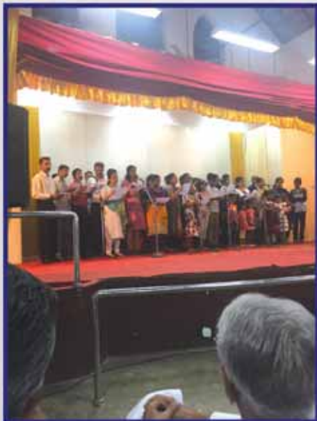
From the Parish Get - together on 23rd September