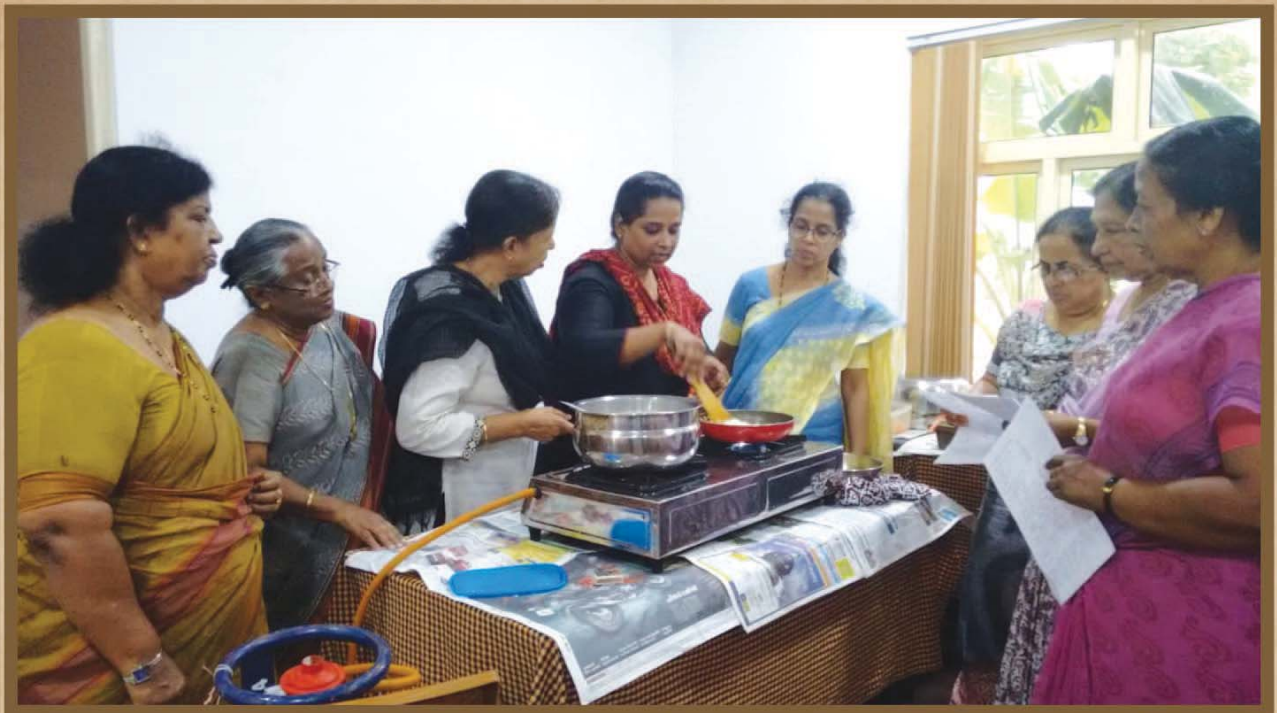
Cooking Class by Women's Fellowship on 20 th September