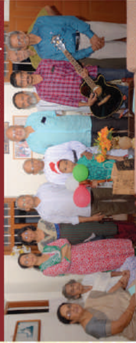
Pattom - Plammood