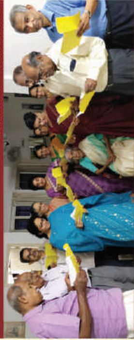
Pongumood - Sreekariyam