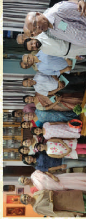
Kowdiar - Kuravankonam