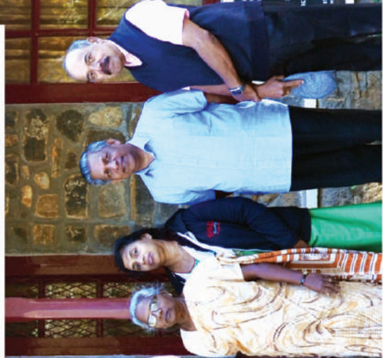
Womens Fellowship Picnic to Kodaikanal & Visit to Palani Mission