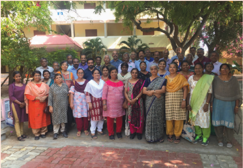
At CSI Retreat Centre Kanyakumari