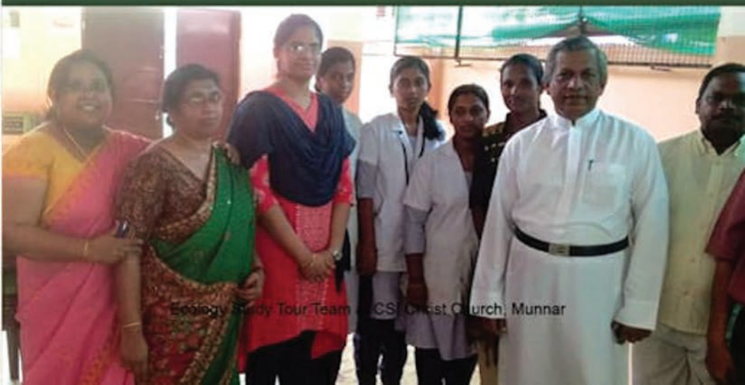
Ecology Study Tour Team - CSI Christ Church, Munnar