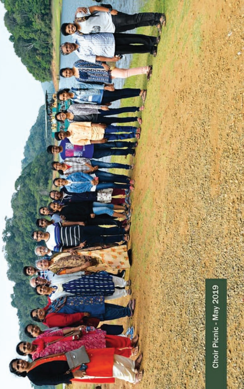
Choir Picnic - May 2019