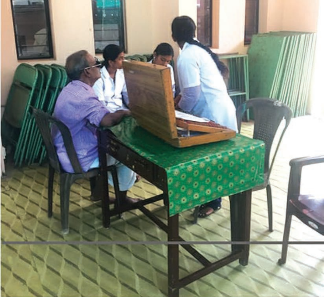
Eye Camp at Karali CSI Church on 11 th May 2019