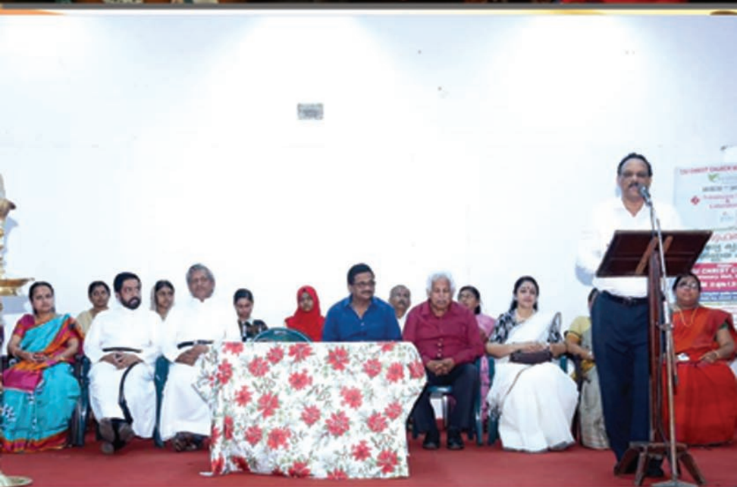
Medical Camp for Cancer Detection - 25-04-2019