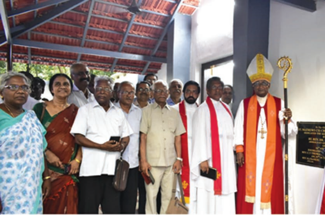
Dedication of Mannaroad CSI Church - 26-04-2019