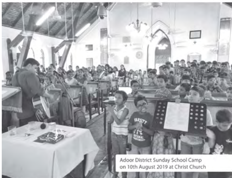
Adoor District Sunday School Camp on 10th August 2019 at Christ Church