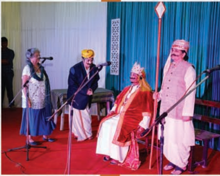
Parish Get Together 29th September 2019