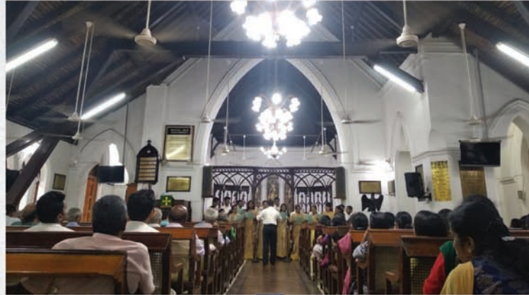
Sunny Walsalam - Richie Walsalam Ecumenical Solo Competition & Musical Evening 22nd September 2019