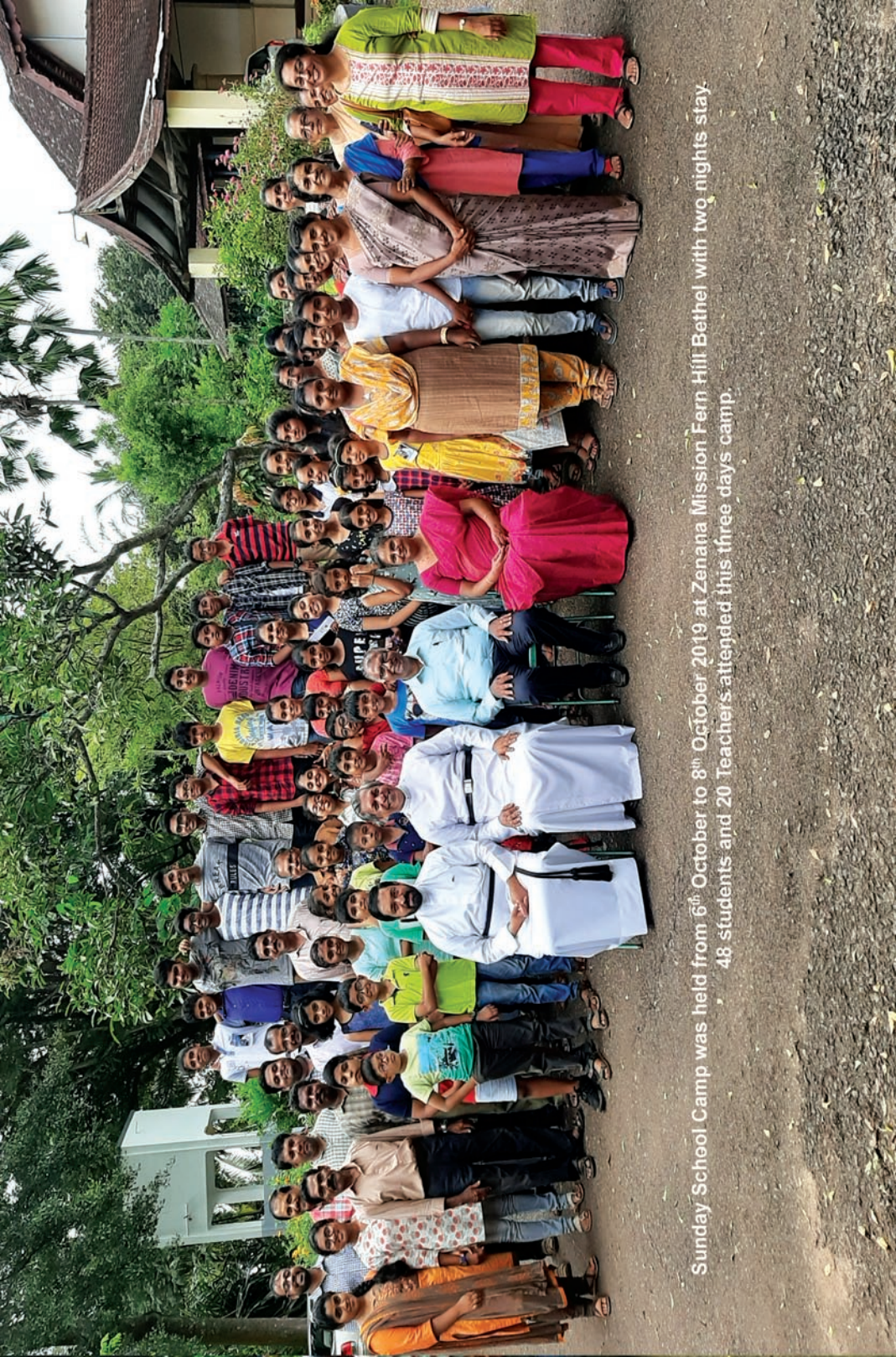
Sunday School Camp was held from 6 th October to 8 th October 2019 at Zenana Mission Fern Hill Bethel with two nights stay. 48 students and 20 Teachers attended this three days camp.