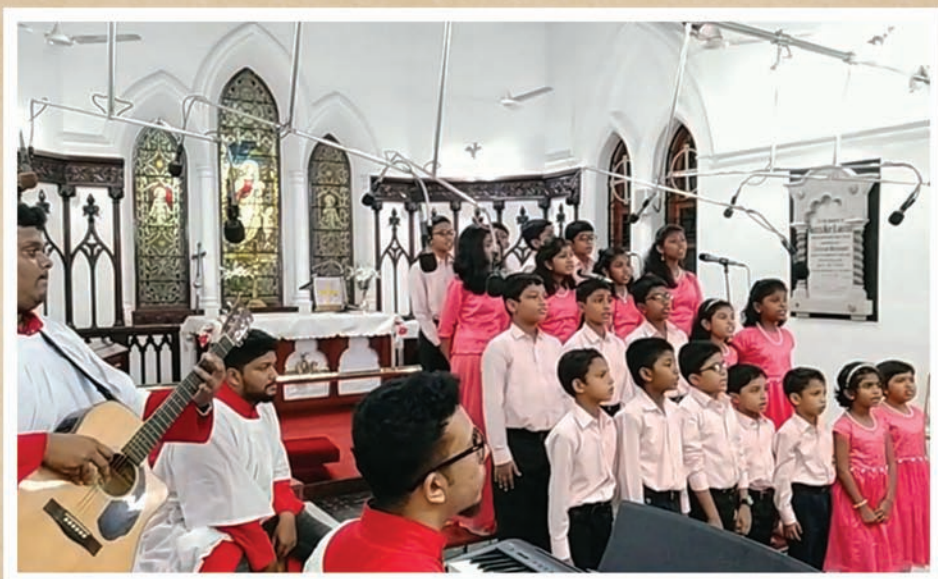
Christmas Carol Service Junior Choir