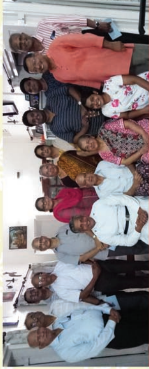
Kowdiar - Kuravankonam