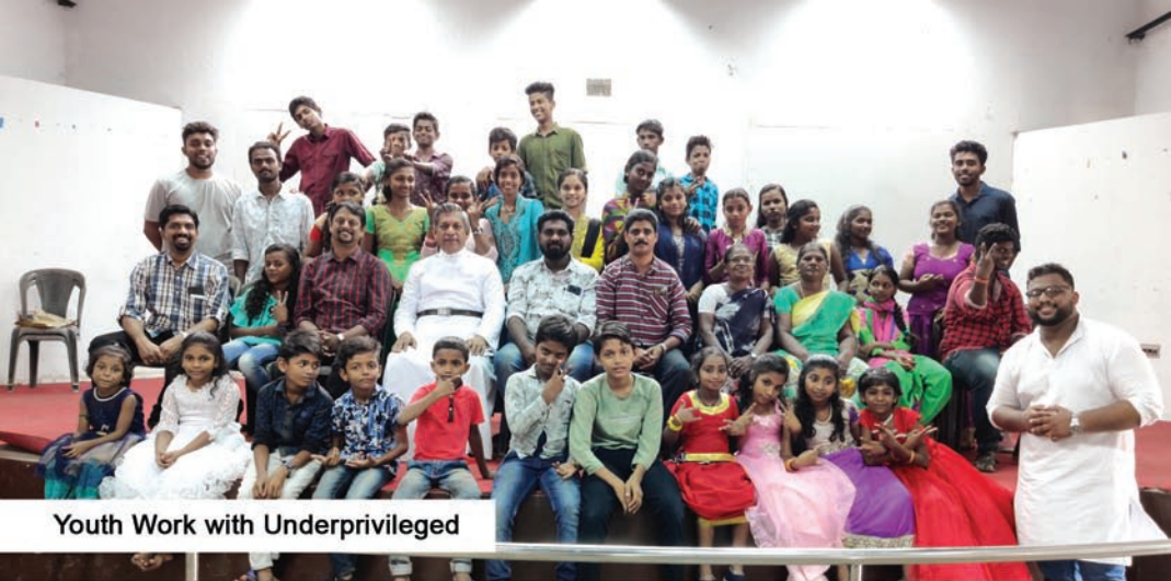
Youth Work with Underprivileged