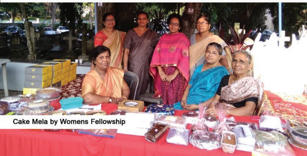
Cake Mela by Womens Fellowship