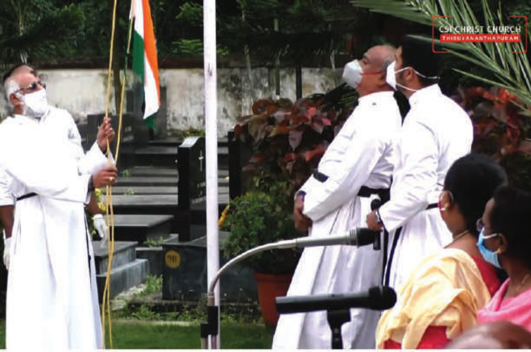
Independence Day Celebration