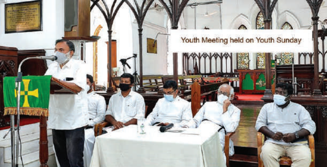
Youth Meeting held on Youth Sunday