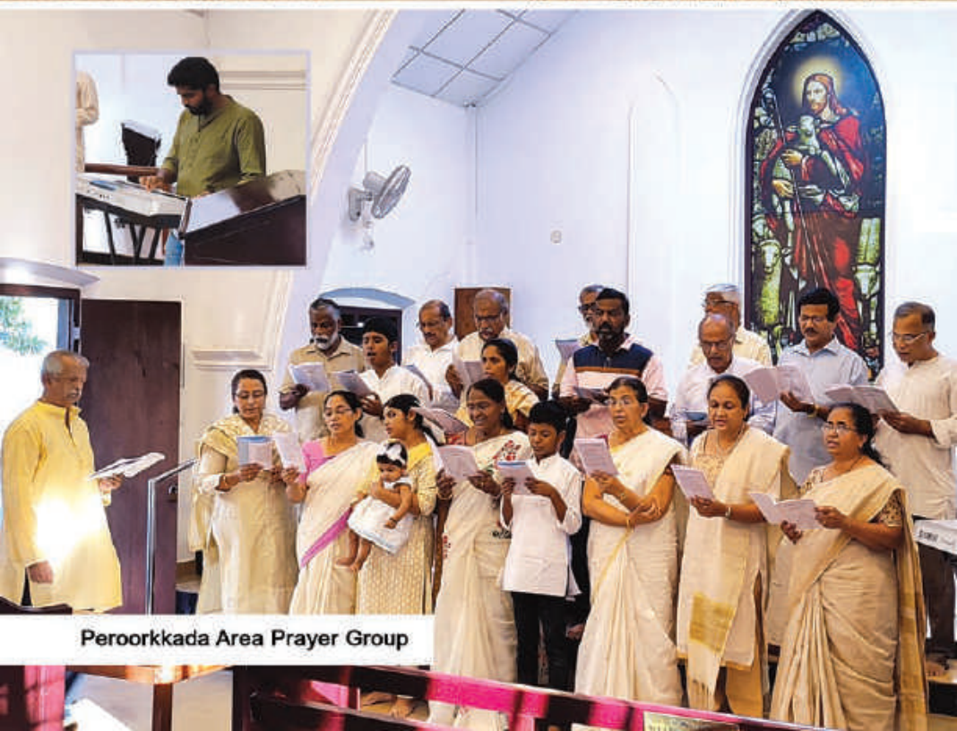
Peroorkkada Area Prayer Group