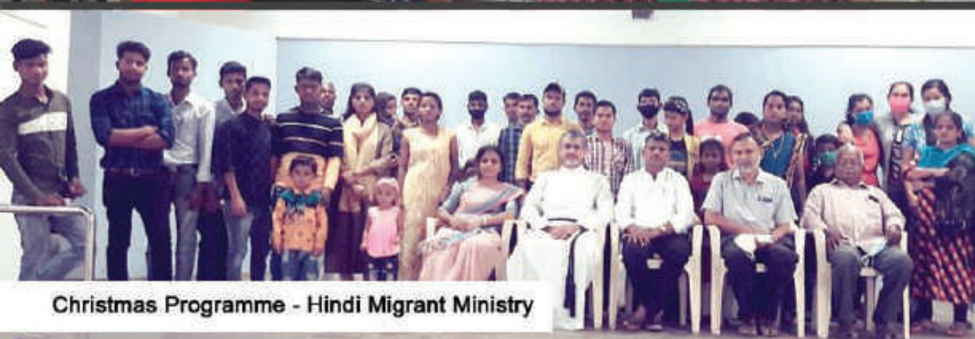
Christmas Programme - Hindi Migrant Ministry