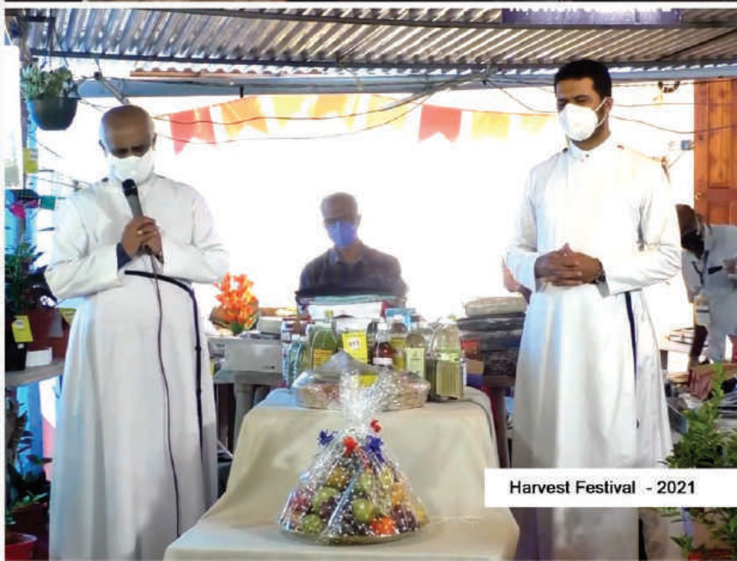
Harvest Festival - 2021