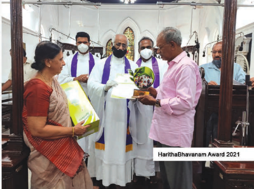
HarithaBhavanam Award 2021