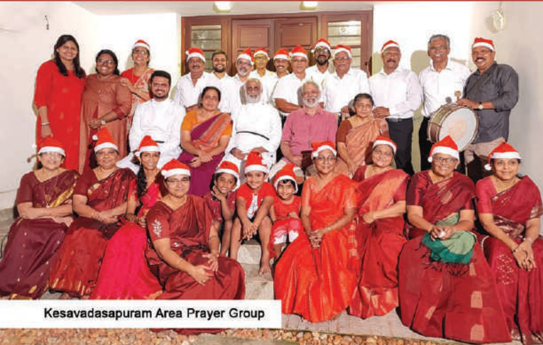
Kesavadasapuram Area Prayer Group