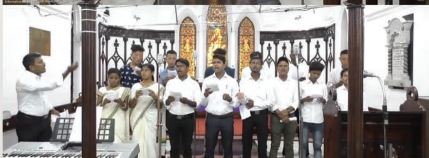
Hindi Worship Group