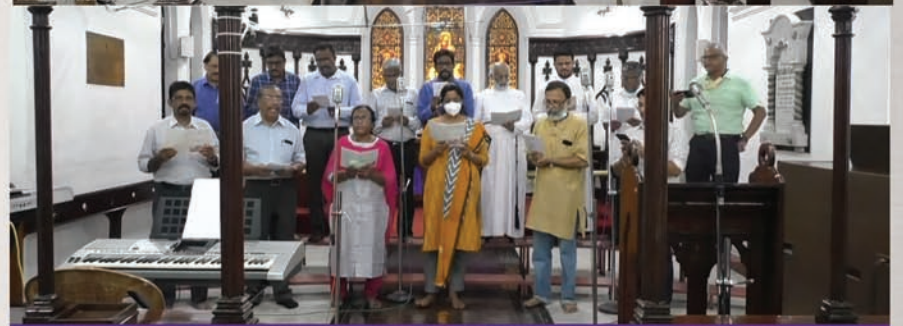
CSI Christ Church Committee