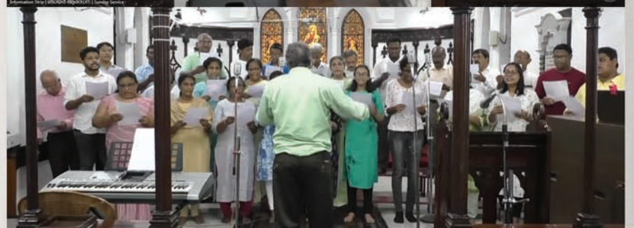
CSI Christ Church Choir