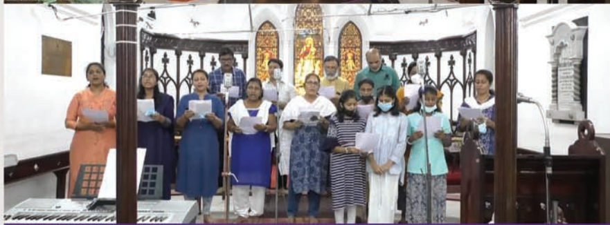
Young Family Fellowship