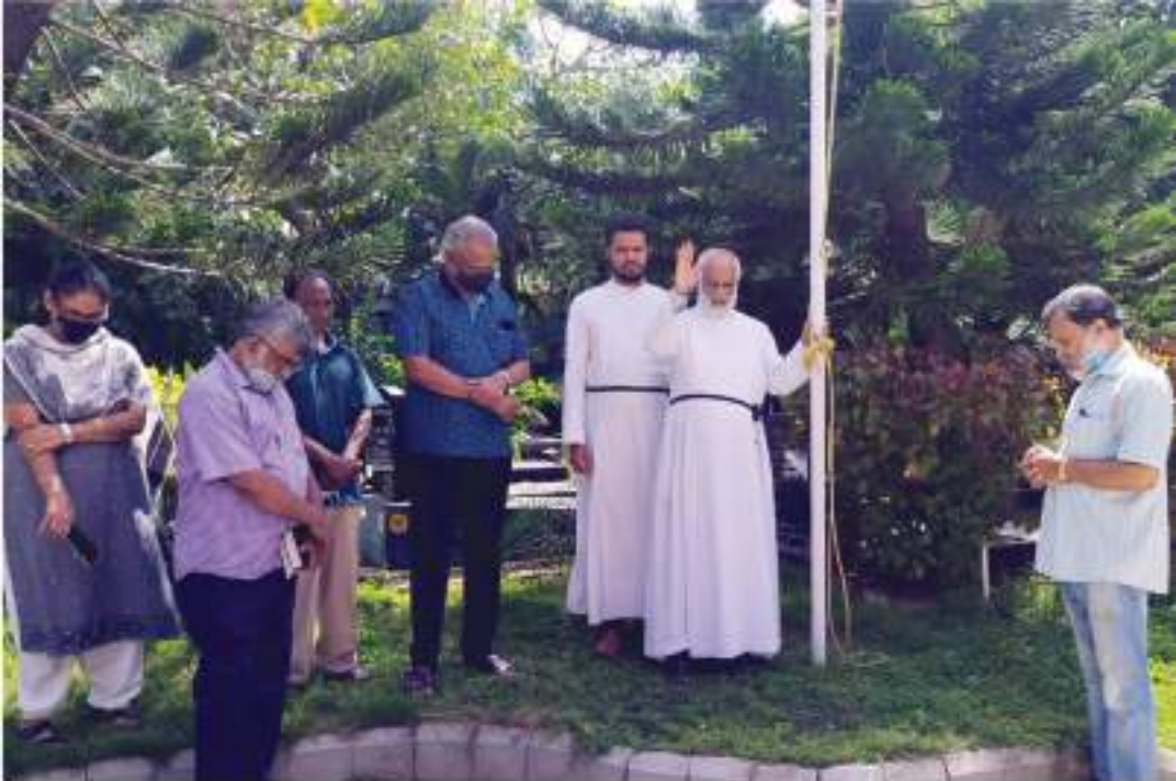
Flag Hoisting and prayer on CSI MKD Formation day