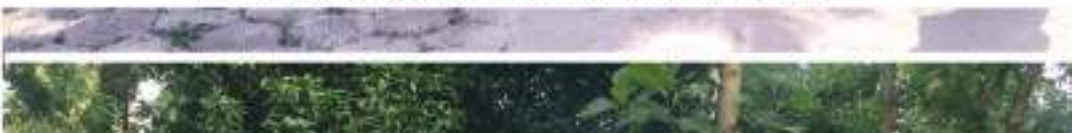
Ecology Forum team at Nedumcaud Agri. University's Research Station on 20th July 22 for attending an exposure programme.