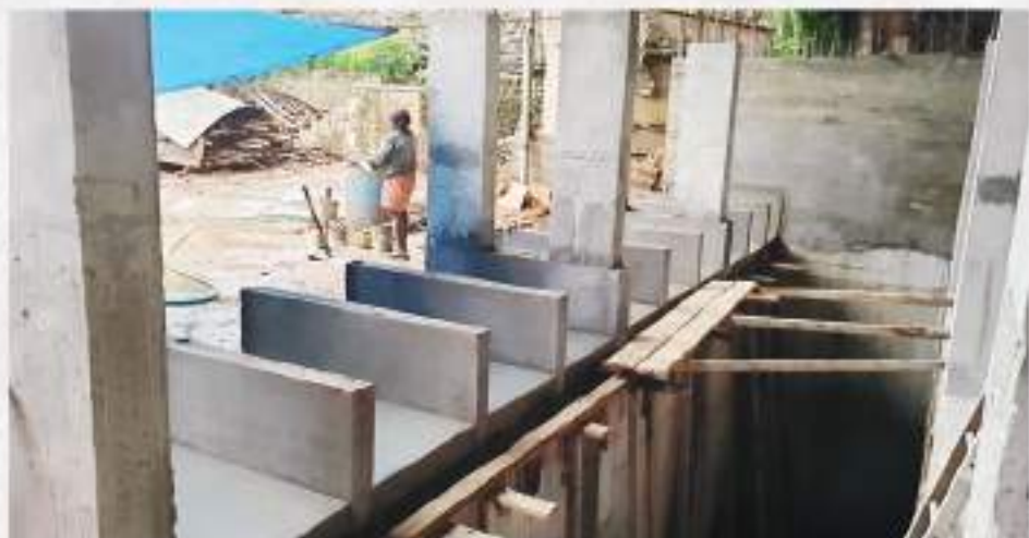
First row of the 10 rows of vaults to be built, under construction