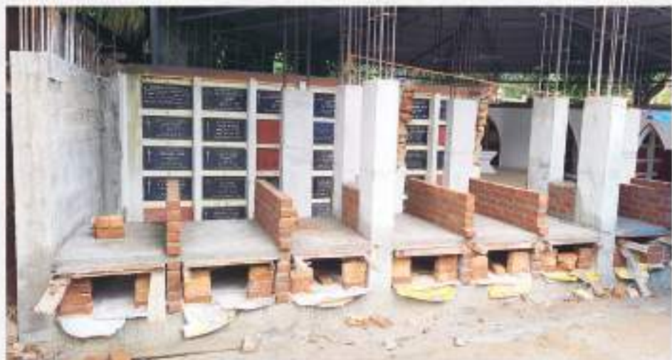
Second row of vault under construction after completion of the first row.

Members who need a family vault cell are encouraged to submit the filled-out application form, and reserve a cell at the current price of rupees one lakh.