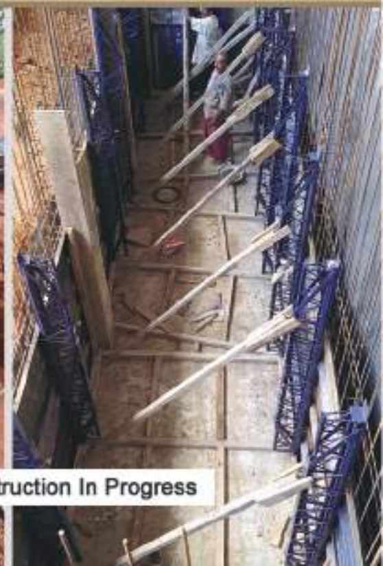
Family Vault construction In Progress