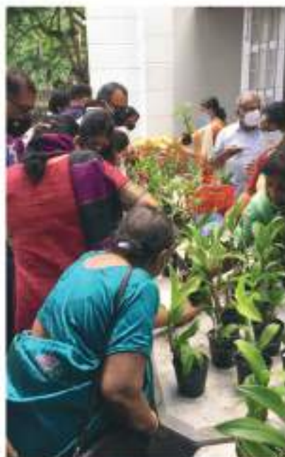
Plants sale by Ecology Forum in connection with Environment Sunday