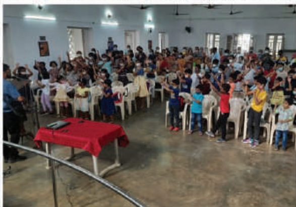
Sunday school half-day Camp Meeting with parents, students, and teachers held on 12th November