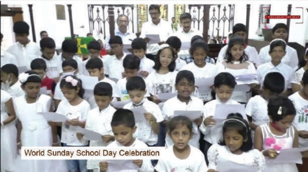
World Sunday School Day Celebration