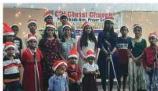
Peroorkkada Area Prayer Group