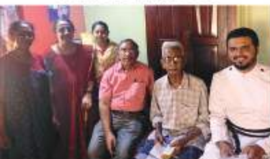
Palayam Area Prayer Group