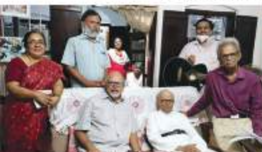
Pattiom Area Prayer Group