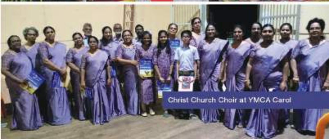
Christ Church Choir at YMCA Carol