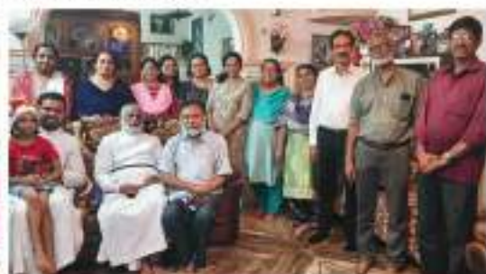
Nanthencode Area Prayer Group