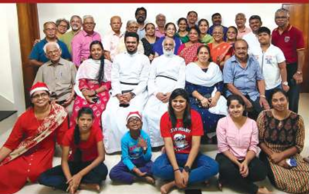
Kesavadasapuram Area Prayer Group