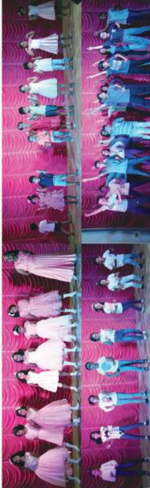
Annual day of the Christ Church Sunday School held on the 4 th of February