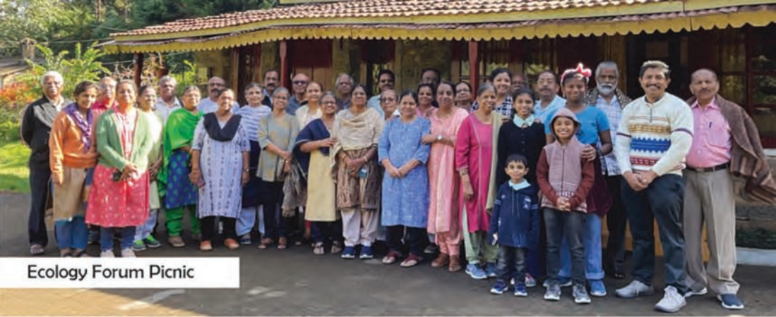
Ecology Forum Picnic