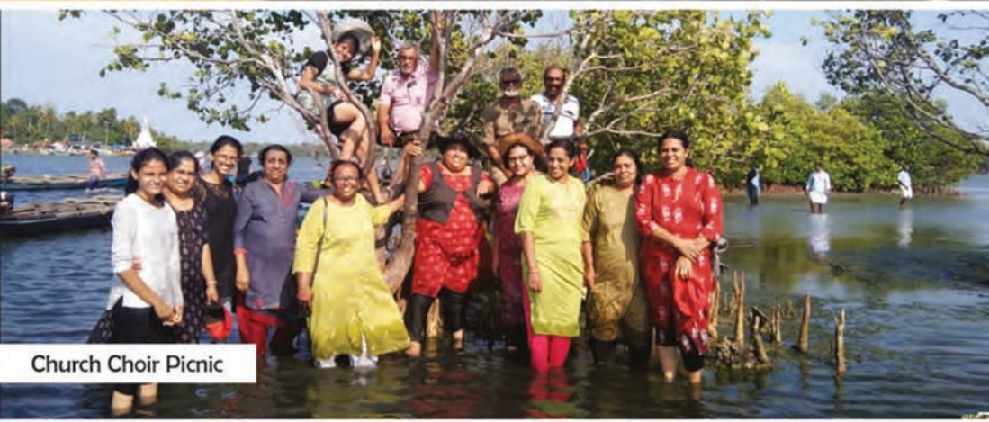
Church Choir Picnic