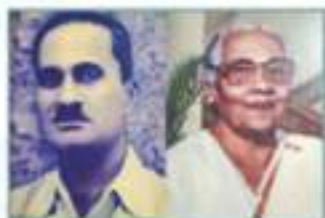
APPACHA & AMMACHY

Appacha & Ammachy, the most special people in my life who gave me a dutiful husband, a wonderful father and grand father to my children & grand child.