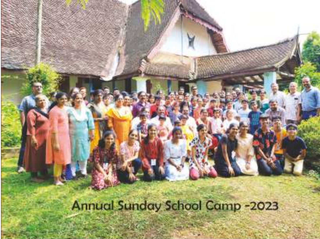
Annual Sunday School Camp -2023