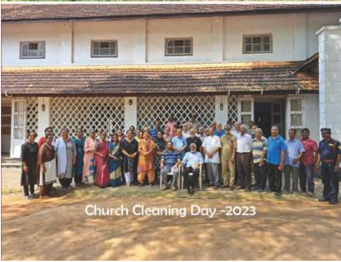
Church Cleaning Day -2023