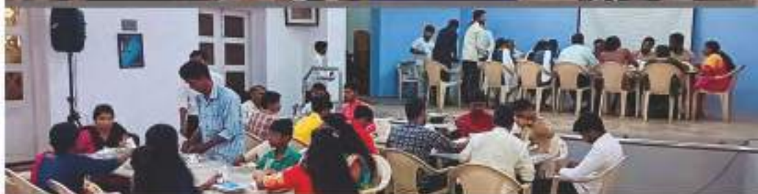
Hindi Migrants special 2 day discipleship program conducted on 29th and 30th of August during Onam

Church compound wall gets a fresh coat of painting, with new pictures and writings.