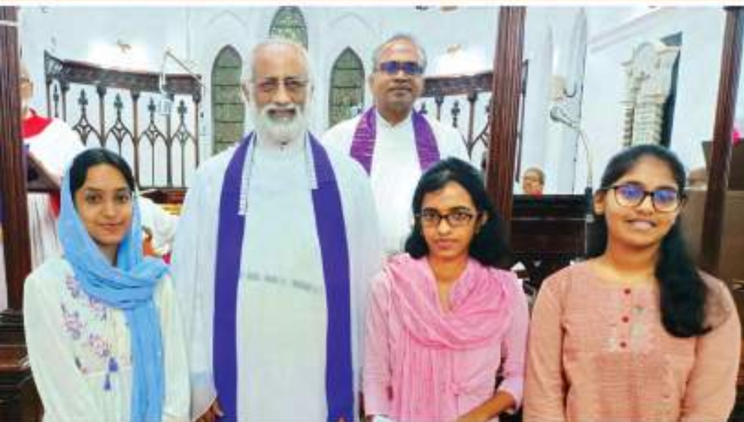
Proficiency Award Winners 2022-2023