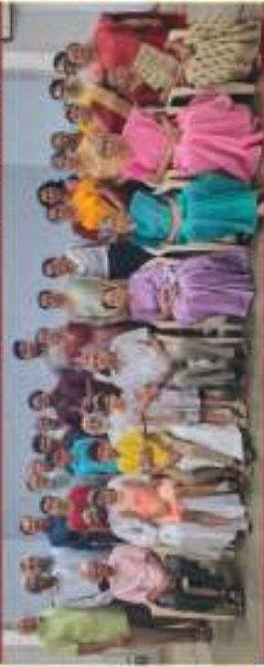
Pattom - Plammood & Kunnukuzhy - Barton Hill