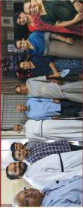
Pettah - Manacaud