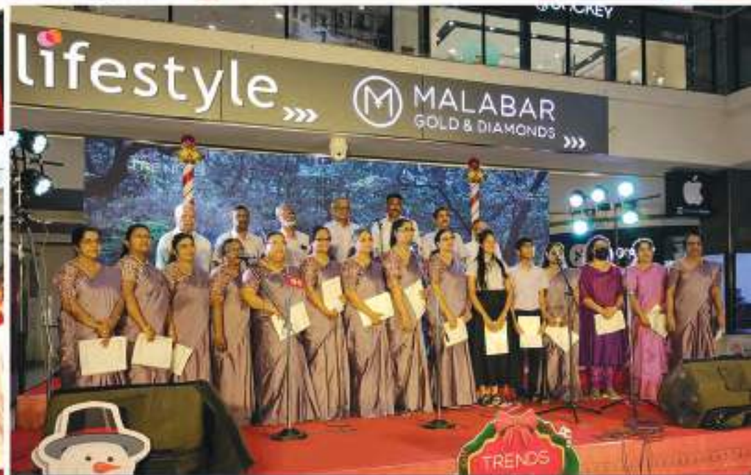
Christ Church Choir performing at Mall of Travancore