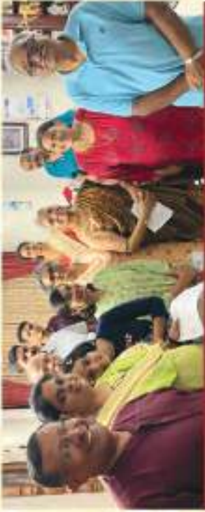
Kowdiar - Kuravankonam