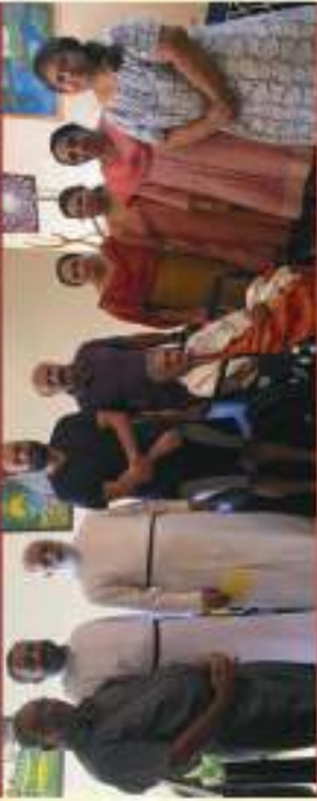
Palayam - Vazhutacaud