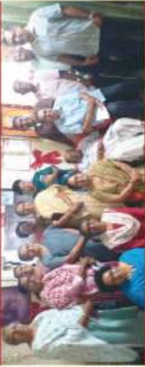
Pongummood - Sreekariyam