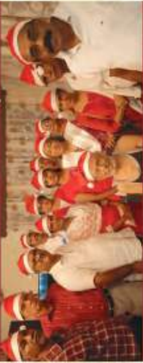
PTP Nagar - Vattiyoorkkavu