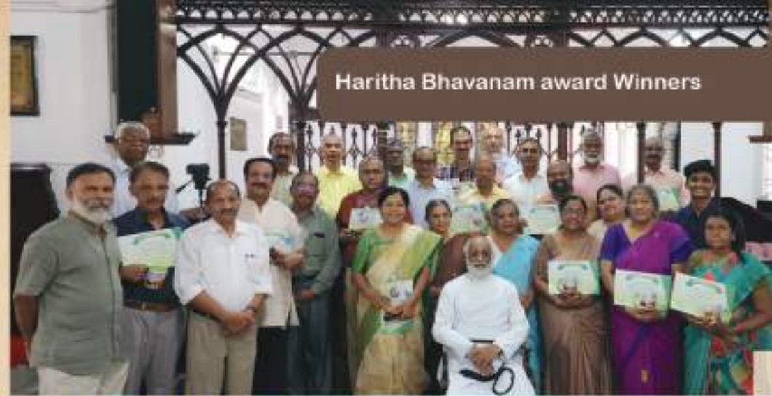
Haritha Bhavanam award Winners