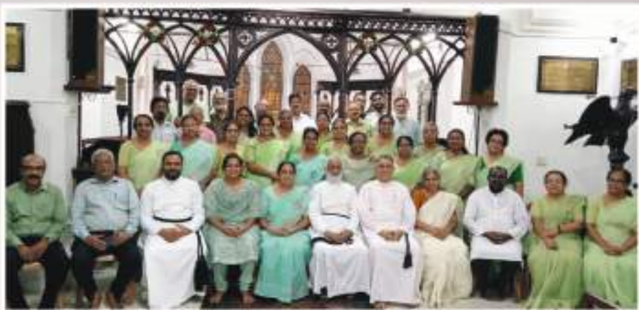
Annual Church Convention Choir 2024