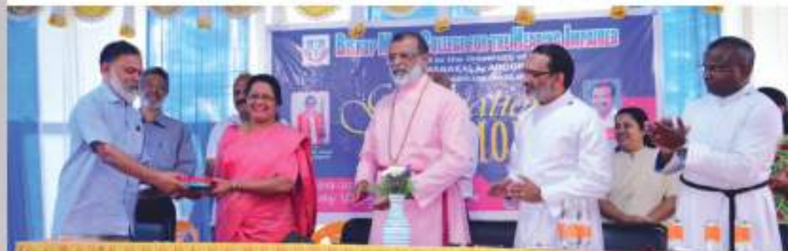
Our support to the Rank holders of Bishop Moore college for the Hearing Impaired