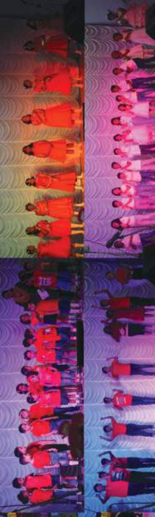
Annual day of the Christ Church Sunday School