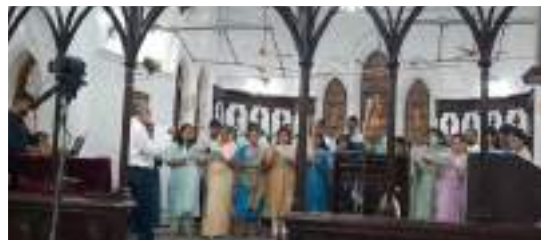
Young Family Fellowship