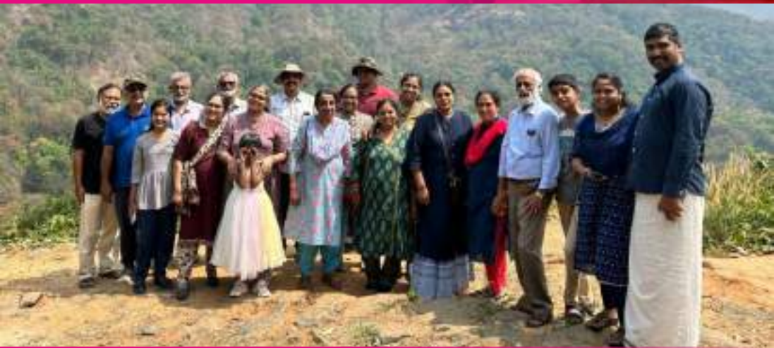
Choir picnic, Nilamboor