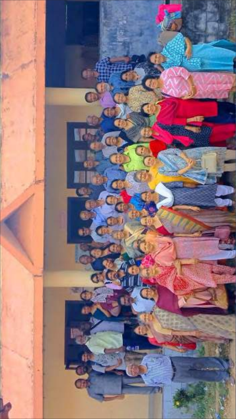
“See Ashtamudi” by Golden Age & Almaya Fellowship