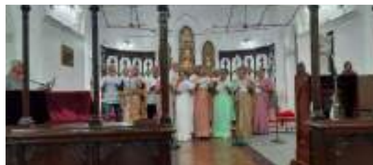
Golden Age Fellowship