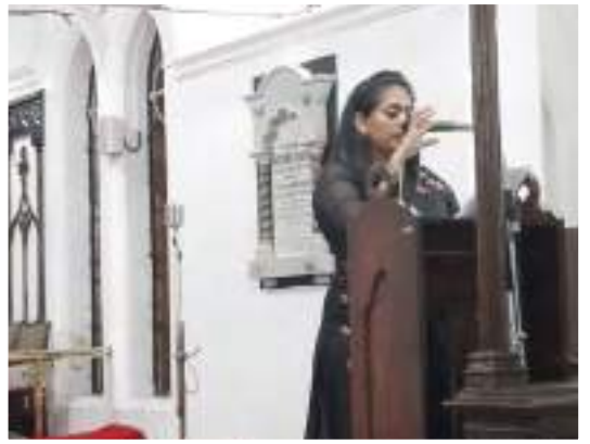
Mrs. Anju Elizabeth George