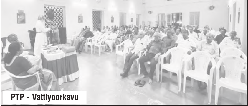
PTP - Vattiyookavu