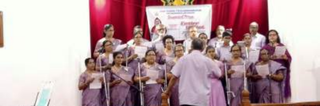
Choir participating in Ecumenical Easter recital at Bethel Mar Thoma Church, Muckolackal