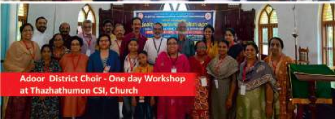
Adoor District Choir - One day Workshop at Thazhathumon CSI, Church