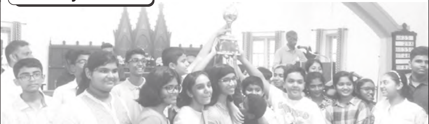
26-08-2024 -ൽ നടന്ന Adoor District Sunday School കലാമത്സരത്തിൽ നമ്മുടെ സൺലേ സ്കൂൾ 335 പോയിന്റ് നേടി ഒന്നാം സ്ഥാനം നിലനിർത്തി. അഭിനന്ദനങ്ങൾ.