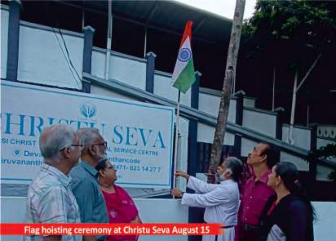
Flag hoisting ceremony at Christu Seva August 15