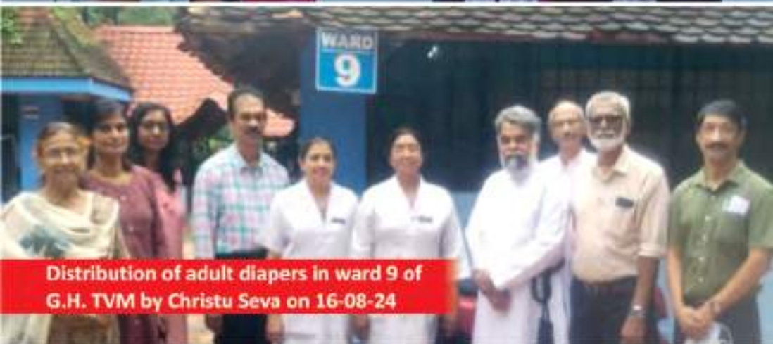
Distribution of adult diapers in ward 9 of G.H. TVM by Christu Seva on 16-08-24