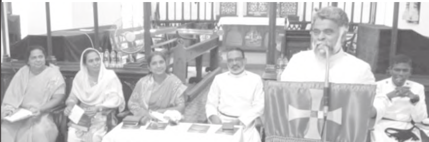
അടൂർ വൈദിക ജില്ല സ്ത്രീജനസഖ്യ കൂട്ടായ്മ : 03-08-24

സ്ത്രീജനസഖ്യത്തിന്റെ ആഭിമുഖ്യത്തിൽ നടത്തിവരുന്ന സാമൂഹ്യ/കാരുണ്യ പ്രവർത്തനങ്ങൾക്കുള്ള സാമ്പത്തിക സമാഹരണത്തിന്റെ ഭാഗമായി സെപ്റ്റംബർ 1, 8 ഞായറാഴ്ചകളിൽ ഒരു മെഗാ സെയിൽ നടത്തുന്നു. എല്ലാ സഭാംഗങ്ങളുടെയും സഹകരണം അഭ്യർത്ഥിക്കുന്നു.