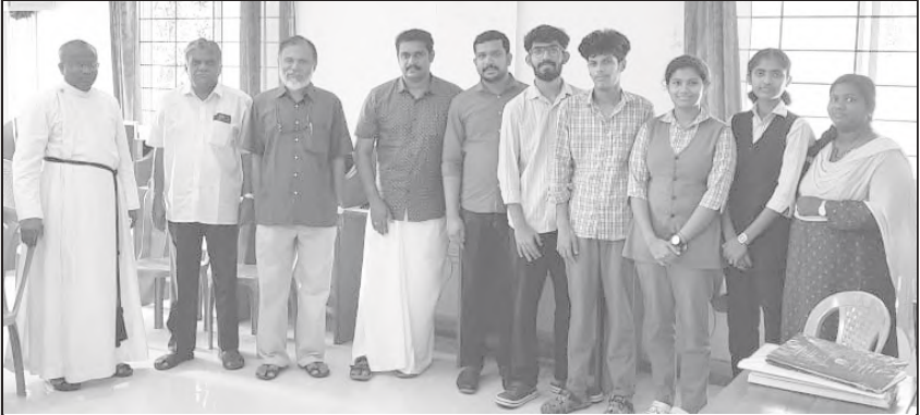
IBS -ൽ നിന്ന് സംഭാവനയായി ലഭിച്ച 15 ഉപയോഗ യോഗ്യമായ used computers Bishop Moore college for the hearing impaired computer Lab - ന് കൈമാറുന്നു.