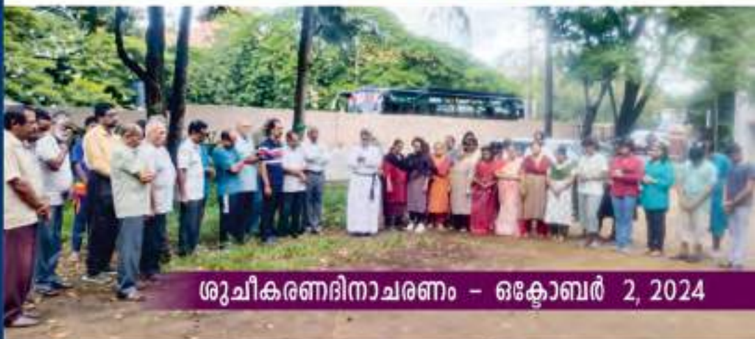
ശുചീകരണദിനാചരണം - ഒക്ടോബർ 2, 2024