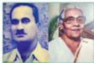
APPACHA & AMMACHY

Appacha & Ammachy, the most special people in my life who gave me a dutiful husband, a wonderful father and grand father to my children & grand child.