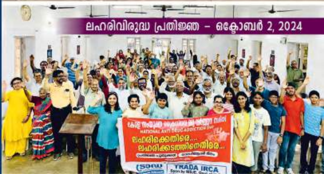
ലഹരിവിരുദ്ധ പ്രതിജ്ഞ - ഒക്ടോബർ 2, 2024