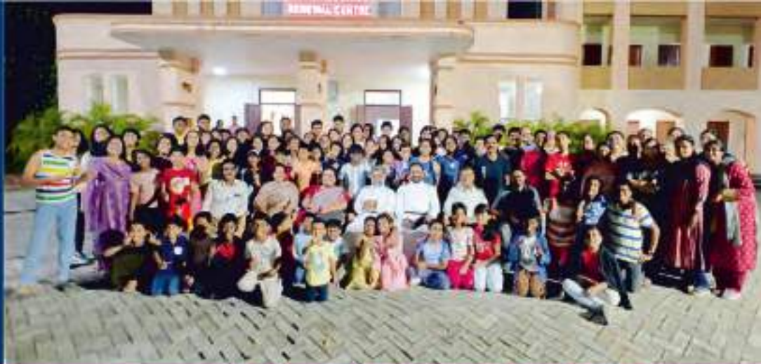
സണ്ടേസ്കൂൾ ക്യാമ്പ് - ഒക്ടോബർ 11-13, 2024