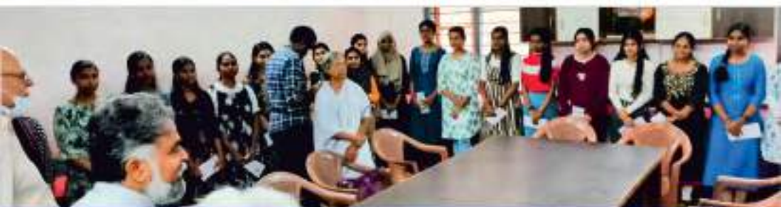
ഫോർട്ട് മിഷൻ നേൽസ് ഹൈസ്കൂൾ - സങ്കോളർഷിപ്പ് വിതരണം