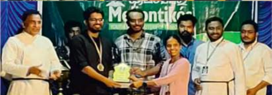
മഹായിടവക യുവജന കലാഭരണ