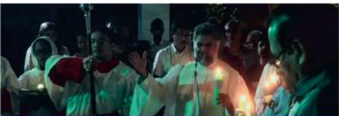
ഉടമ്പടി ശുശ്രൂഷ 01-01-2025