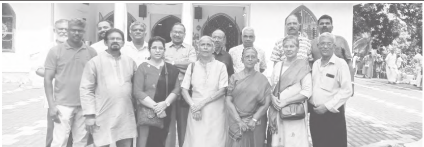
അടിമ വിമോചന വിളമ്പരം 190-ാമത് വാർഷിക സമ്മേളനം, മൺട്രോത്തുരുത്ത് - ആൽമായ സംഘടന