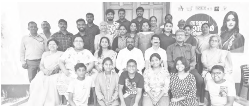
മാർച്ച് 2 ഞായർ - മെഡിക്കൽ ഫോറത്തിന്റെ ആഭിമുഖ്യത്തിൽ കാരാളി, സെന്റ് ലൂക്ക് സഭയിൽ വച്ച് നടത്തിയ മെഡിക്കൽ ക്യാമ്പ്