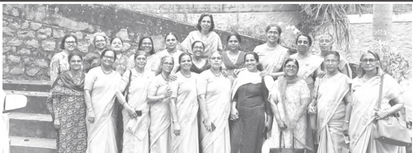
സ്ത്രീജനസഖ്യം - മഹായിടവക കലാമേള