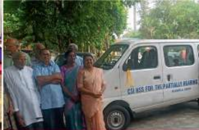
അടൂർ മണക്കാല ഹിയറിംഗ് ഇംപയേർഡ് സ്കൂളിനുള്ള വാനിന്റെ താക്കോൽ ദാനം