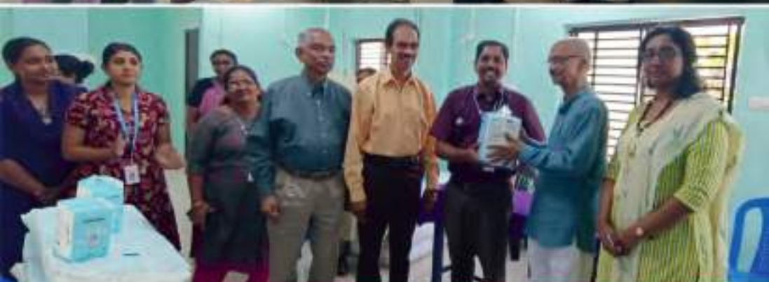
ക്രിസ്തുസേവ - കാരുണ്യ പ്രവർത്തനം, പൂഴനാട്, ഗവ: ഫാമിലി ഹെൽത്ത് സെന്റർ - പാലിയേറ്റീവ് കെയർ